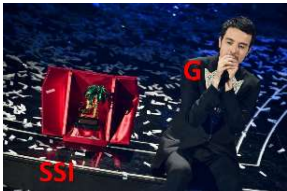
"Domina il palco"

77. Imago _____ 2\ 3\ 7\ 1: 2\ 1\ 2 = 8\ 2\ 8 Marluk