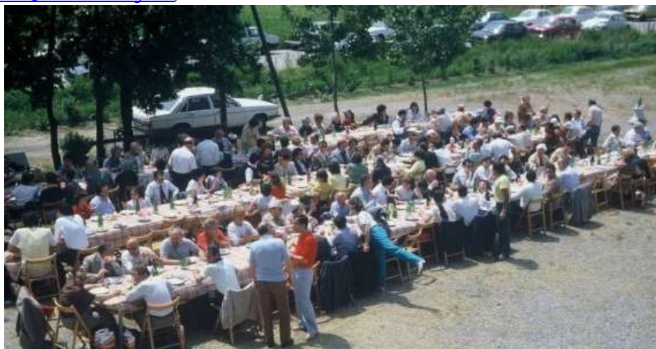
Modena, 1982 - 3° Convegno Nazionale Rebus A.R.I. L'abbuffata finale sull'aia del Colombarone